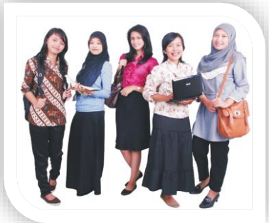
Gambar 2. Contoh Pakaian bagi Mahasiswa Putri ketika Beraktivitas di Kampus