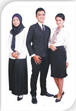
Gambar 5. Pakaian bagi Mahasiswa ketika Mengikuti Yudisium