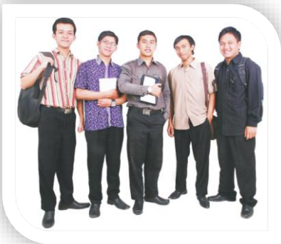
Gambar 1. Contoh Pakaian bagi Mahasiswa Putra ketika Beraktivitas di Kampus