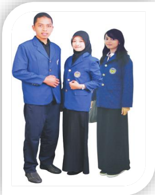
Gambar 4. Pakaian bagi Mahasiswa Putra ketika Kegiatan PKL dan KKN/PPL