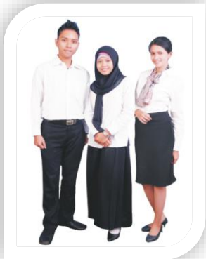
Gambar 3. Contoh Pakaian bagi Mahasiswa ketika Mengikuti Kuliah Micro Teaching